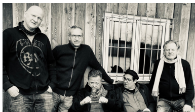
Steyler`s Garden - Foto: Dominik Wasshuber