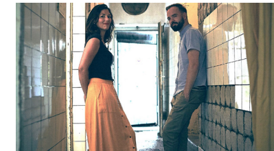
Via Zwo